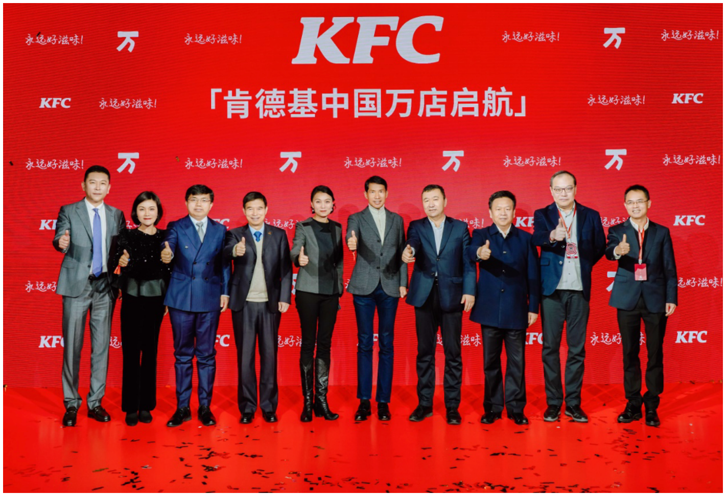
到場嘉賓共同見證肯德基中國萬店啟航

值此萬店起航之際，商務部專程向百勝中國發來賀信。商務部表示，百勝中國積極在華開展投資經營，取得巨大成功，獲得豐厚回報，為中國經濟和社會發展做出積極貢獻，並鼓勵公司繼續積極擴大對華投資，深耕中國市場，深化互利共贏。