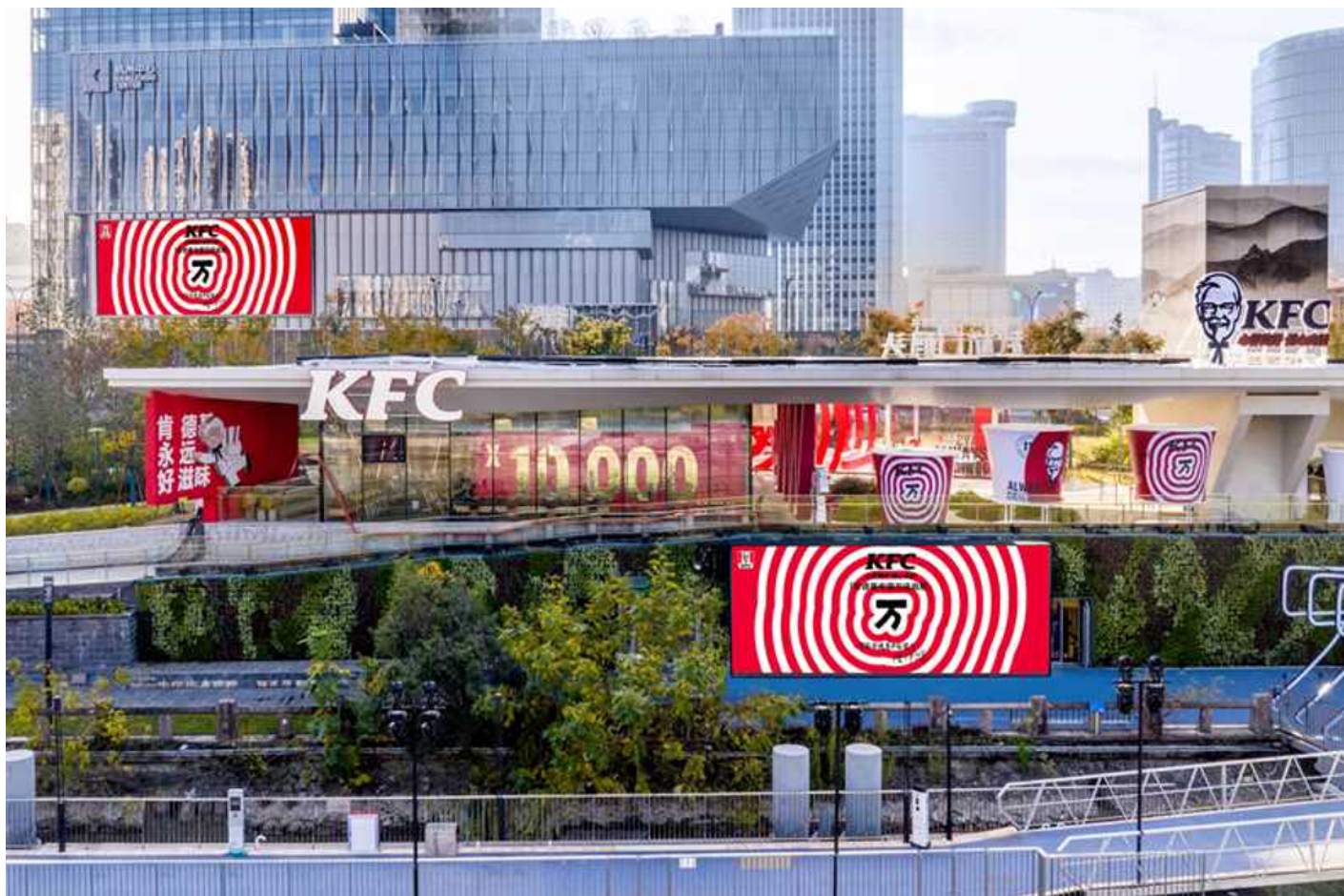
肯德基京杭大運河餐廳

百勝中國首席執行官屈翠容女士 (Joey Wat) 表示：“1987年，肯德基來到中國，在北京前門開出了第一家西式速食連鎖餐廳。36年來，我們堅持初心，沿著京杭大運河，一路不斷將美食與美好傳遍兩岸。今天，肯德基第一家門店在杭州正式開業，這不僅是品牌歷史上的一個重要里程碑，也是肯德基未來征程的新起點。以萬為始，我們即將邁入下一個快速增長階段，期望到2026年，能讓肯德基的美食和服務覆蓋到中國超7億消費者，人群規模實現50%以上的增長，讓更多人輕鬆享受到方便快捷的美味，讓肯德基成為觸手可及的每日餐飲首選。”