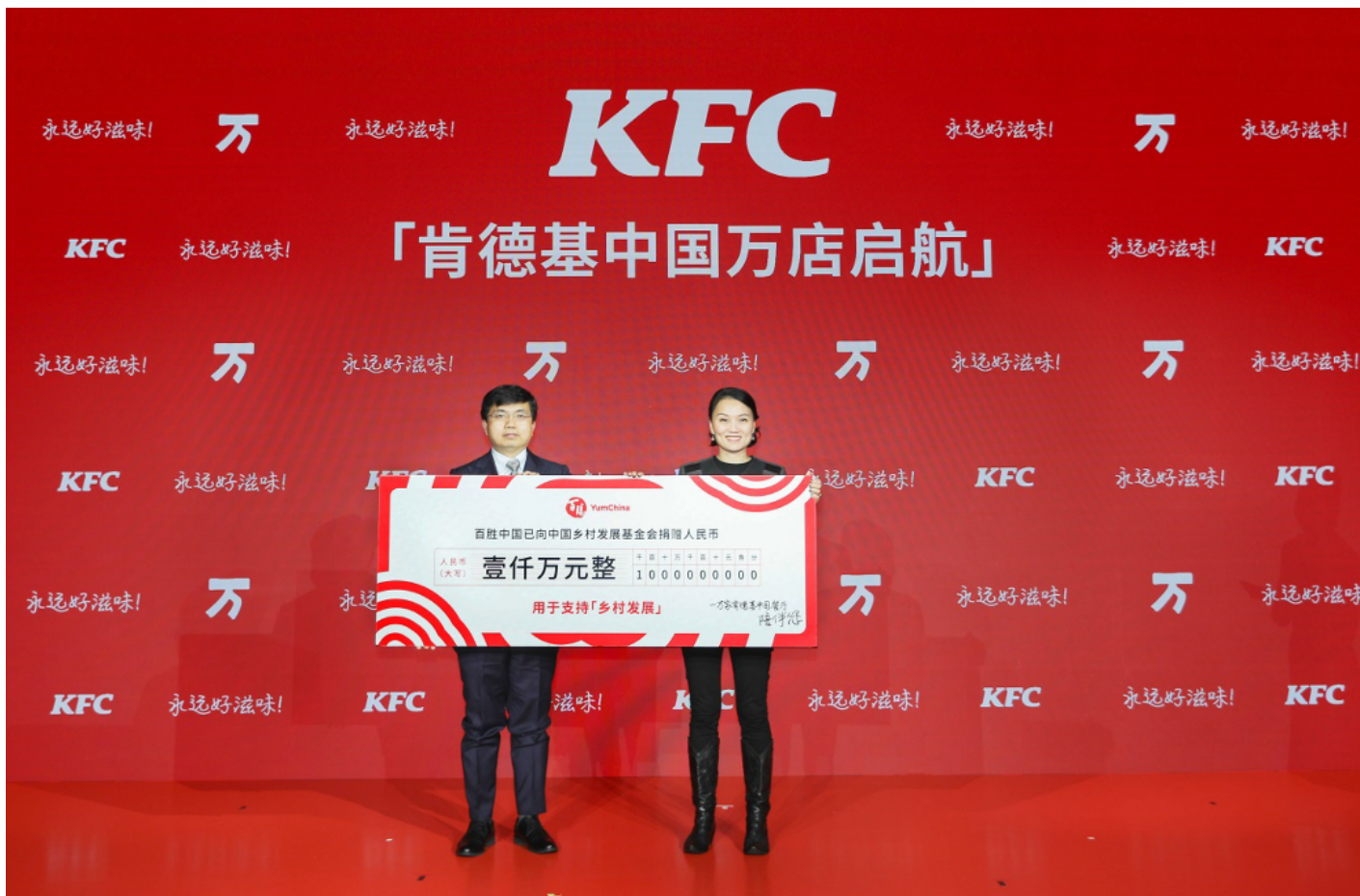
百勝中國向中國鄉村發展基金會捐贈1,000萬元

對邁入「萬店時代」的肯德基而言，新的征程才剛剛開始。立上潮頭，錨定未來，肯德基將在「永遠好滋味」的全新品牌主張指引下，以初心和恆心踐行對消費者的不變承諾，為中國餐飲業的永續發展注入動力、活力與創造力。