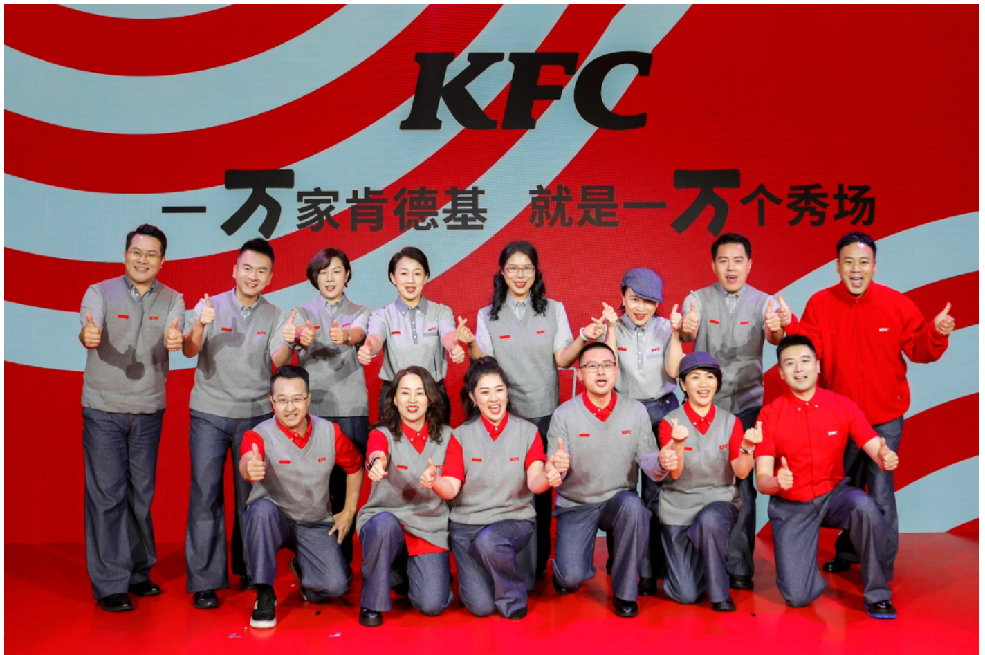
肯德基發佈員工全新制服

其三，秉持仁心正行的理念，百勝中國及旗下肯德基等品牌在發展路上一一直積極踐行社會責任。為更好地支持中國鄉村發展事業，百勝中國已提前向中國鄉村發展基金會捐贈了1,000萬元，其中部分已用於支持鄉村兒童關愛和災害救援。肯德基以全國線下餐廳網路為支點，依託於隨手公益、注重實效、長期主義、多元發展的公益內核，逐步完善了肯德基品牌公益體系，包括歷經二十年發展的三對三青少年籃球賽事，進入全國一百多個城市的“食物驛站”，惠及全國二十幾個省份兒童的小候鳥基金、十一年來堅持為殘障員工提供就業發展的天使餐廳等。未來，肯德基將繼續用行動關愛弱勢群體，保護自然環境，攜手更多社會力量，共益明天，一起自在。